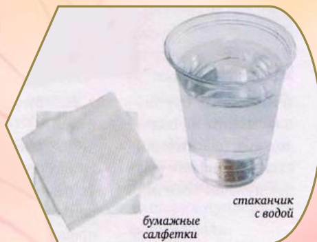
Баночка с водой