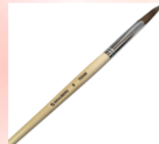
Кисточка для смачивания теста